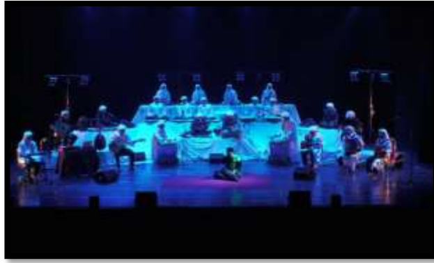
Gambar 4. Karya Bagian kedua ( Tajalli )

Tahap tajalli merupakan fase intensifikasi tekstur dan kehadiran musikal. Pada tahap ini, struktur musikal mencapai tingkat kepadatan dan kontinuitas tertinggi. Tekstur bunyi menjadi lebih berlapis, dengan densitas yang meningkat secara signifikan melalui polifoni vokal, repetisi intensif, dan tumpang tindih bunyi. Peran tubuh pemain beralih dari pengendali ke medium kehadiran, di mana tindakan musikal tidak lagi diproduksi secara reflektif, tetapi hadir sebagai respons yang menyatu dengan situasi bunyi. Relasi kolektif mencapai bentuk keterlarutan bersama, ditandai oleh sinkronisasi gestur, intensitas emosional, dan kesadaran ruang yang dibagi secara kolektif. Pada fase ini, kondisi Malalu terwujud sebagai keterlarutan total antara tubuh, bunyi, dan pengalaman batin. Salah satu contoh pola berlapis dengan adanya repetisi ritmis yang saling terintegrasi dapat dilihat pada notasi di bawah ini.