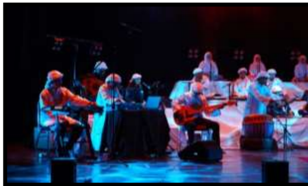
Gambar 6. Foto Karya Bagian kedua ( Tajalli )