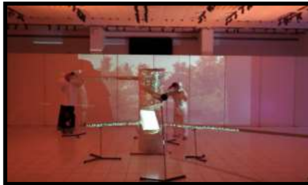
Gambar 2. Karya Bagian pertama ( Takhalli ) (Dok. Indra Ariffin, 2026)

Sedangkan video berperan bukan sebagai dokumentasi melainkan sebagai karya audiovisual (Hernanda & Barnawi, 2025).