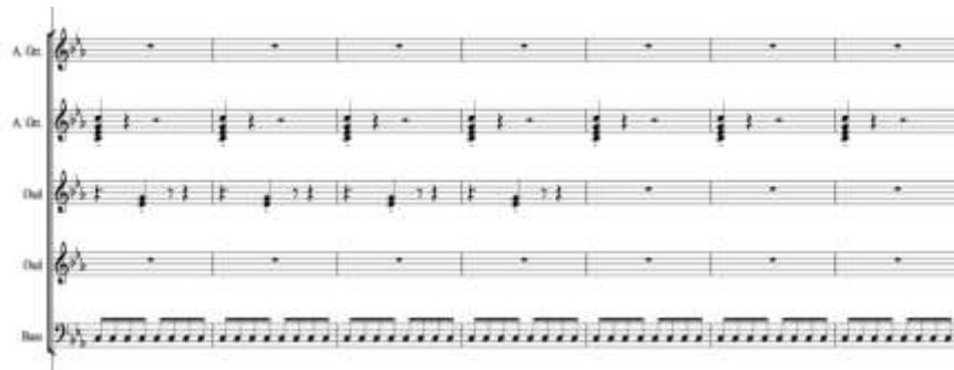
Gambar 5. Notasi Intensifikasi ritmis melodis pada karya Tajalli (Transkrip. Indra Ariffin, 2026)

Tahap tajalli merupakan fase intensifikasi tekstur dan kehadiran musikal. Pada tahap ini, struktur musikal mencapai tingkat kepadatan dan kontinuitas tertinggi. Tekstur bunyi menjadi lebih berlapis, dengan densitas yang meningkat secara signifikan melalui polifoni vokal, repetisi intensif, dan tumpang tindih bunyi. Peran tubuh pemain beralih dari pengendali ke medium kehadiran, di mana tindakan musikal tidak lagi diproduksi secara reflektif, tetapi hadir sebagai respons yang menyatu dengan situasi bunyi. Relasi kolektif mencapai bentuk keterlarutan bersama, ditandai oleh sinkronisasi gestur, intensitas emosional, dan kesadaran ruang yang dibagi secara kolektif. Pada fase ini, kondisi Malalu terwujud sebagai keterlarutan total antara tubuh, bunyi, dan pengalaman batin. Salah satu contoh pola berlapis dengan adanya repetisi ritmis yang saling terintegrasi dapat dilihat pada notasi di bawah ini.