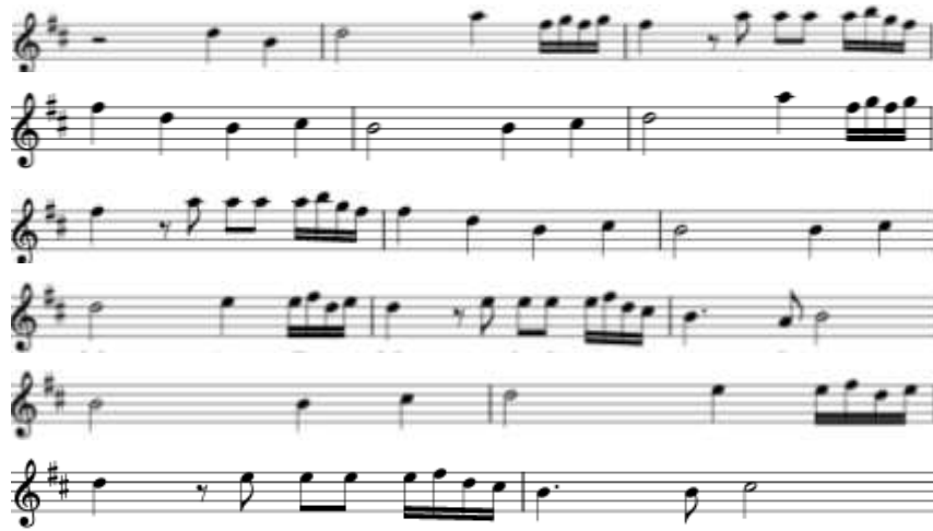
Notasi 3: Mayank Rizkia Youlanda (Transkrip, 10 Januari 2025)

Akhir dari materi di atas menandakan perpindahan dari bagian satu ke bagian dua, bagian kedua yang diawali transisi vokal mengalir lembut sebanyak dua kali pengulangan, kemudian masuk free vokal laki-klaki yang mana tempo pada free ini berangsur naik/cepat dan diakhiri dengan materi unisono oleh seluruh instrument: