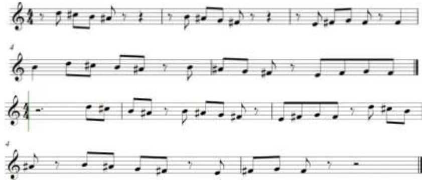
Notasi 9: Mayank Rizkia Youlanda (Transkrip, 10 Januari 2025)

Melodi di atas dilakukan dua kali pengulangan kemudian dilanjutkan dengan materi unisono oleh seluruh instrumen sebanyak empat kali. Pada pengulangan ketiga dan empat disertai unison vokal dengan melodi yang sama: