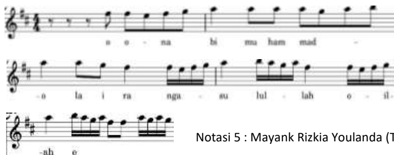
Notasi 5 : Mayank Rizkia Youlanda (Transkrip, 10 Januari 2025)

“Oo nabi Muhammad olai ra nga ngasu lullah o ilallah Eeeee oooo eeee oo oo”