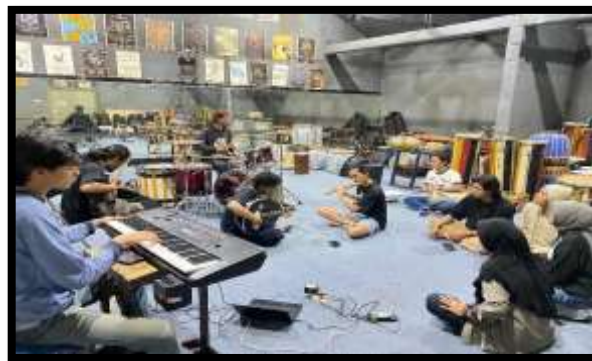
Gambar 3. Proses eksplorasi

Eksplorasi merupakan proses melibatkan ide-ide yang telah dikumpulkan. Ide-ide yang telah dikumpulkan disusun lalu diproses, tujuannya untuk menghasilkan pemahaman yang mendalam terhadap elemen-elemen musik. (Susanti et al., 2025). Eksplorasi menurut (Widiatmika, 2015) sebuah proses berfikir, berimajinasi, merasakan, dan merespon segala bentuk ide yang timbul dalam menciptakan sebuah karya seni. Dalam proses penciptaan komposisi musik karawitan “Sanjungan” eksplorasi dilakukan dengan berbagai cara antara lain: eksplorasi bunyi berupa pemilihan beberapa instrument melodi seperti oud , seruling violin dan keyboard . Hal ini di anggap mampu merepresentasikan nuansa timur tengah yang hadir melalui tangga nada minor. Eksplorasi lain dilakukan pada vokal dengan cara memperlambat tempo lagu sehingga memperkuat kesan religius pada karya ini.