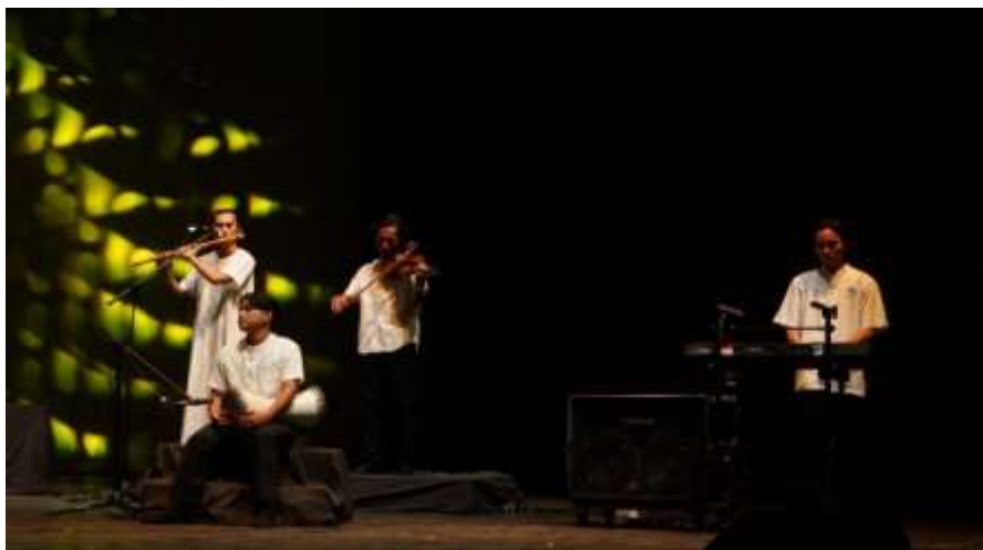
Gambar 5. Pertunjukan karya bagian satu (Gedung Pertunjukan Hoeridjah Adam, 7 Januari 2025)

Komposisi musik karawitan “ Sanjungan ” ini terbagi atas dua bagian. Pada bagian awal karya dimulai dengan drone instrument keyboard dan langsung di-isi dengan permainan eksploratif instrument oud . Kemudian Bagian ini disambut oleh isian instrument melodi seruling dan violin secara bergantian yang beralaskan chord instrument keyboard dan bass sebagai nada dasar dari melodi.