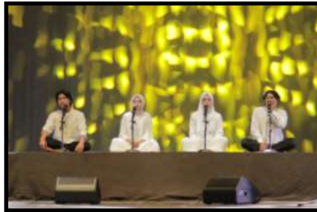
Gambar 6. Vokalis komposisi “Sanjungan” (Gedung Pertunjukan Hoeridjah Adam, 7 Januari 2025)

selanjutnya masuk transisi oleh free vokal, setelah free masuk materi vokal: