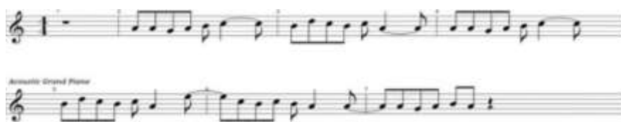
Notasi 4: Mayank Rizkia Youlanda (Transkrip, 10 Januari 2025)

Akhir dari materi di atas menandakan perpindahan dari bagian satu ke bagian dua, bagian kedua yang diawali transisi vokal mengalir lembut sebanyak dua kali pengulangan, kemudian masuk free vokal laki-klaki yang mana tempo pada free ini berangsur naik/cepat dan diakhiri dengan materi unisono oleh seluruh instrument: