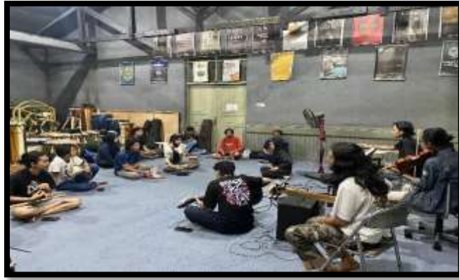
Gambar 4. Proses Realisasi Karya (Dok. Ananda Riyani, November 2024)

Tahap penyelesaian lebih berfokus pada penyempurnaan setiap bagian karya, berikut unsur-unsur yang terdapat didalamnya. Pada tahap ini juga dilakukan perubahan kecil pada bagian awal karya yaitu dengan mengekspose kekuatan garap vokal sehingga kesan religius menjadi sangat dominan.