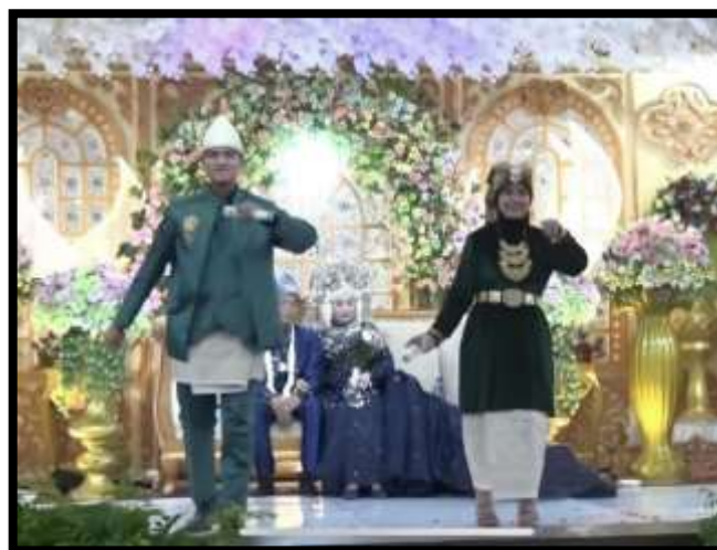
Gambar 4. Pertunjukkan Senjang Duet pada Upacara Pernikahan

Kostum dalam pertunjukan Senjang berfungsi memperkuat suasana sekaligus merepresentasikan identitas budaya lokal. Penutur biasanya mengenakan pakaian adat seperti teluk belango , songket , atau busana tradisional Melayu. Selain menambah keindahan visual, kostum ini mencerminkan kesopanan, wibawa, dan penghormatan terhadap adat.