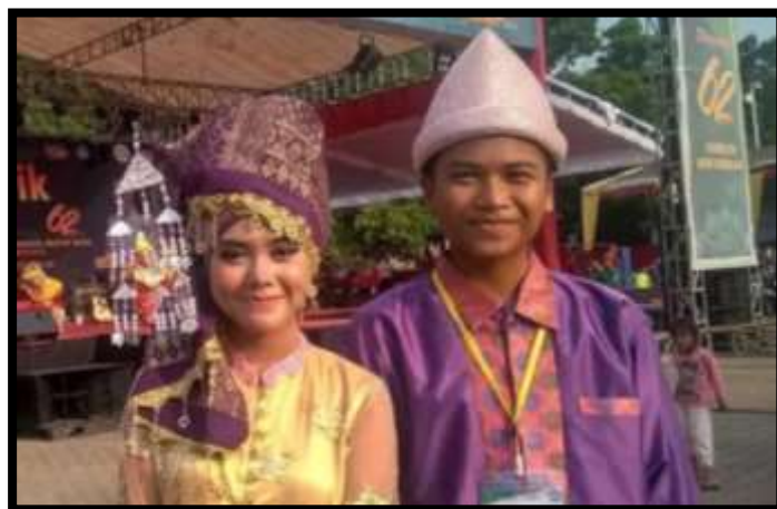
Gambar 3. Pesenjang Duet

Seperti disampaikan oleh (Syeilendra, 2000) untuk bisa mengekspresikan emosi dengan maksud mengundang penonton agar bisa merasakan emosi itu, perlu sang seniman sendiri betul-betul beremosi yang sesuai dengan yang disajikan. Karena itu, seniman Senjang biasanya memiliki kemampuan bahasa yang tinggi, piawai merangkai kata, dan mahir berimprovisasi dengan gaya halus, jenaka, namun tetap sopan.