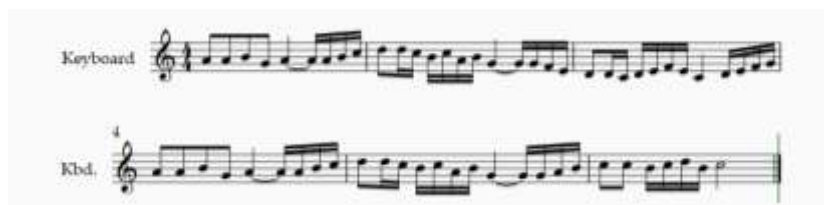
Gambar 1. Notasi Musik Senjang

Alat musik keyboard kini menjadi pengiring utama dalam pertunjukan Senjang di Desa Sukajaya. Pergeseran ini mencerminkan adaptasi kesenian Senjang terhadap perkembangan zaman tanpa menghilangkan struktur penyajiannya yang khas. Berikut bentuk melodi instrumen musik Senjang . Adapun melodi yang dimaksud adalah sebagai berikut C= do