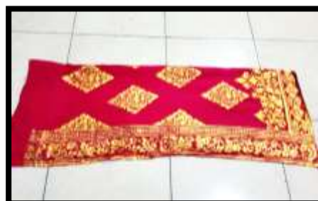
Gambar 9. Kamen Condong Legong Kraton

Kamen prada merupakan kain berwarna merah yang dihiasi dengan prada berwarna keemasan dan bermotif wajik. Selain motif wajik terdapat juga motif dedaunan dan juga bunga. Kamen dipergunakan dengan cara dililitkan pada bagian tubuh bawah.