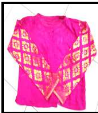
Gambar 4. Baju Condong Legong Kraton