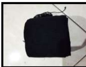
Gambar 11. Sabuk lilit

Sabuk lilit biasa dipergunakan sebelum memakai sabuk prada fungsinya untuk membentuk badan penari terlihat cengked dan membuat penari berpostur tubuh tegak.