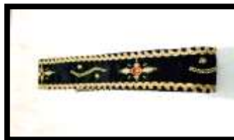
Gambar 5. Tutup dada

Tutup dada merupakan sebuah kain beludru yang mempunyai panjang kurang lebih 100 cm berwarna hitam yang dipergunakan untuk menutupi bagian dada atas setelah lamak dipasang.