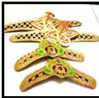
Gambar 8. Gelang kana

Berdasarkan pandangan dari Bandem (Bandem, 1983:79) Gelang kana merupakan aksesoris busana tari yang dipasang pada bagian lengan atas dan pergelangan tangan. Gelang kana berbahan dasar kulit sapi kemudian dibentuk sesuai dengan motif yang ditentukan lalu di cat prada emas dan ditambahkan hiasan permata.