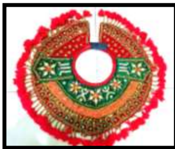
Gambar 3. Badong manis

Badong merupakan aksesoris busana tari Bali berbentuk lingkaran pada leher hingga menutupi pundak. Badong biasanya dibuat dari bahan seperti beludru yang dihiasi dengan payet, manik-manik, atau prada emas, sehingga memancarkan kesan megah dan sakral saat terkena cahaya panggung. Aksesoris ini juga memiliki peran sebagai pelindung tubuh bagian atas sekaligus penegas karakter peran penari.