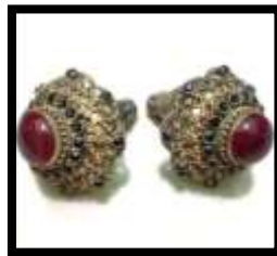
Gambar 2. Subeng

Subeng merupakan perhiasan yang dipakai pada telinga dengan warna keemasan dan dihiasi dengan permata. Subeng tidak hanya untuk memperindah penampilan penari tetapi juga berperan dalam mencerminkan kesatuan visual yang harmonis antara busana dan karakter yang dibawakan.