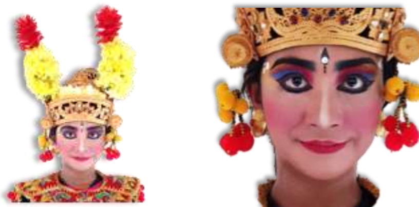
Gambar 13. Tata rias tari Condong Legong Keraton