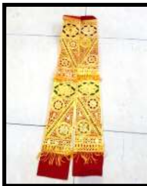
Gambar 6. Lamak Condong Legong Kraton

Lamak merupakan hiasan yang dipasang dibagian dada tangan secara menggantung untuk mempertegas tampilan busana bagian tas. Lamak berbentuk persegi panjang dengan kombinasi warna keemasan berupa kulitan yang diukir atau dipahat dengan motif hias tradisional. Dalam tari Condong dipergunakan dua buah lamak berukuran relatif kecil dibandingkan dengan yang dikenakan oleh penari Legong . Perbedaan ukuran ini mencerminkan perbedaan status dan juga karakter yang diperankan.