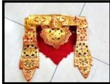
Gambar 7. Ampok-ampok

Berdasarkan pandangan dari Bandem (1983: 73) ampok-ampok merupakan suatu bagian atau jenis busana tari yang menghiasi pinggang dalam beberapa jenis tari. Ampok-ampok dipergunakan setelah memakai sabuk lilit prada . Ampok-ampok berbahan dasar kulit sapi yang dibentuk dan dicat prada emas.