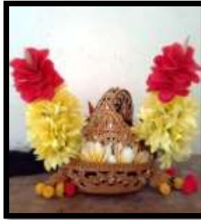
Gambar 1. Gelungan Condong