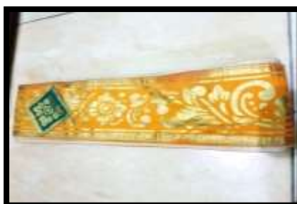
Gambar 10. Sabuk lilit prada emas (Dok. Enita, 2025)

Sabuk lilit prada dipergunakan mengelilingi tubuh penari yang dipakai dari bawah cethik hingga dibawah ketiak. Sabuk lilit prada ini berwarna kuning dan terdapat motif keemasan.