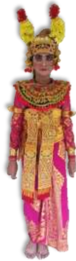
Gambar 14. Tata busana tari Condong Legong Keraton (Dok. Enita, 2018)